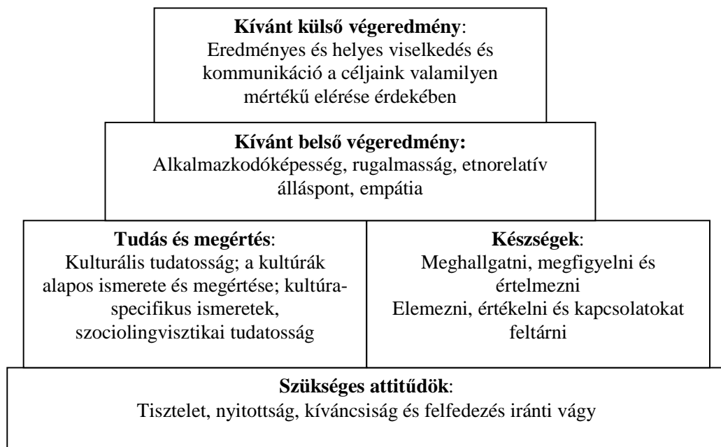
1. ábra Az interkulturális kompetencia piramis modellje (Deardorff 2006, p. 254)

Fantini (2000, 2006) az ICC fogalmának három összetevőjét említi: a kapcsolatok kialakításának és fenntartásának képessége, a hatékony és megfelelő (minimális veszteséggel vagy torzulással járó) kommunikációra való képesség, és a közös érdek vagy igény megvalósítását célzó együttműködési képesség. Ezen interakciós képességek mellett Fantini (2006) a kompetencia öt dimenzióját határozza meg: a már korábban említett tudatosság, attitűd, képességek és ismeretek mellett azonos fontosságot tulajdonít a nyelvismeretnek, mondván „az interkulturális kompetencia sine qua non -ja, hogy az ember alternatív módokon tudjon érzékelni, fogalmat alkotni és kifejezni magát” (p. 37), és ennek elsajátításában hasznos eszköz a nyelvtanulás.